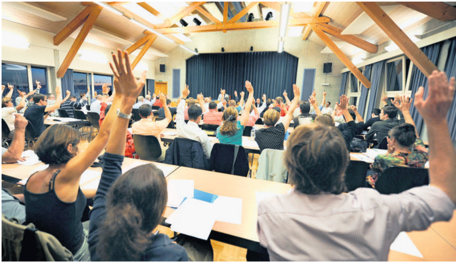
Les conseillers des cinq villages fusionnés, réunis lundi à Aran-Villette, ont souvent voté à l'unanimité.